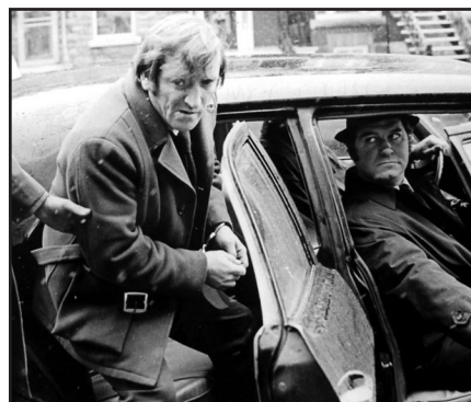
Jean Lapointe dans LES ORDRES